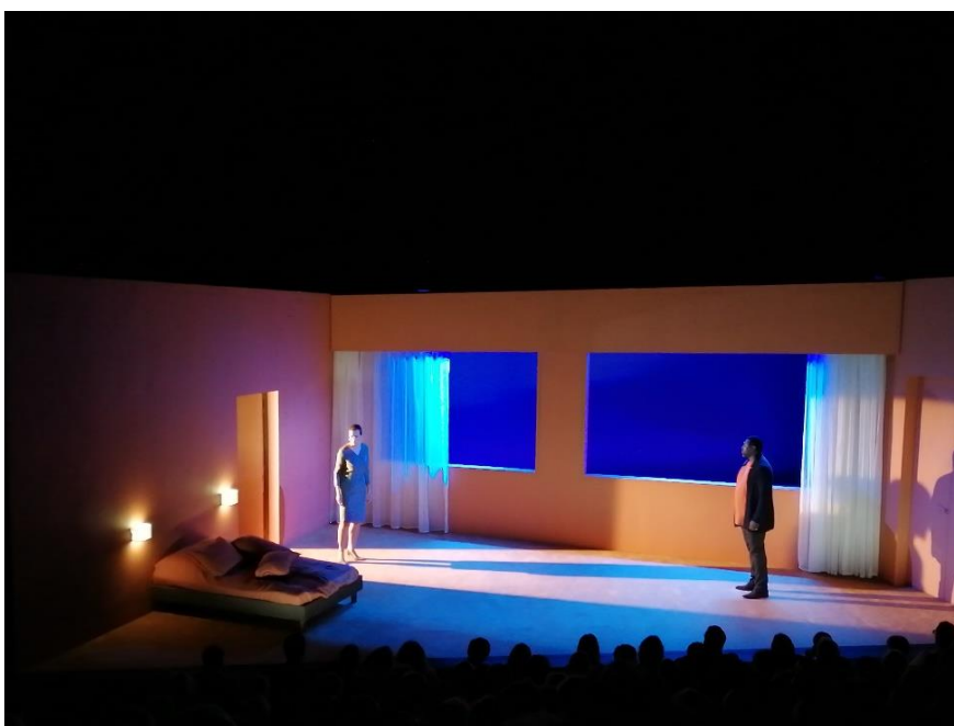
Bérénice de Jean Racine, m.e.s. Muriel Mayette-Holtz

- Une journée autour de l'œuvre de metteur en scène d'Alain Françon est aussi à l'étude.